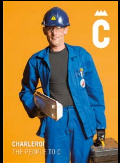
CHARLEROI THE PEOPLE TO C