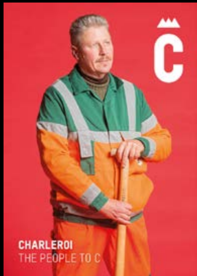
CHARLEROI THE PEOPLE TO C