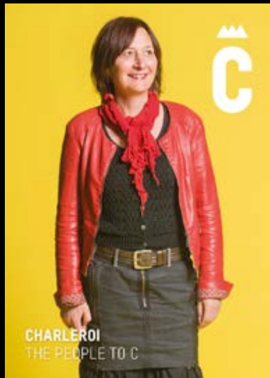
CHARLEROI THE PEOPLE TO C