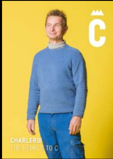
CHARLEROI THE PEOPLE TO C