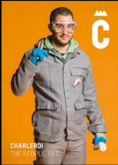
CHARLEROI THE PEOPLE TO C