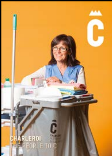
CHARLEROI THE PEOPLE TO C