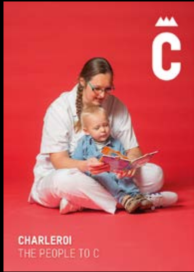
CHARLEROI THE PEOPLE TO C