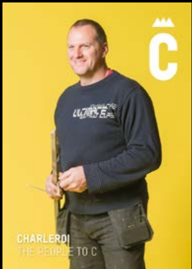
CHARLEROI THE PEOPLE TO C