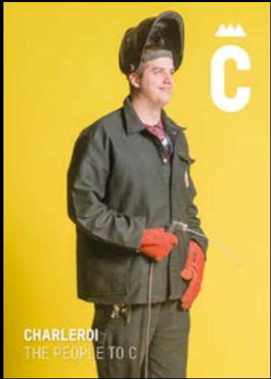
CHARLEROI THE PEOPLE TO C